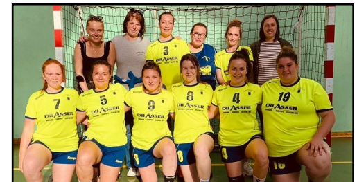
L'équipe sénior féminine

Renseignements : guerlesquinaise-handball29@gmail.com