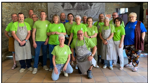
Les bénévoles du comité avant le moules-frites

Pour une année de redémarrage, la soirée moules-frites a retrouvé son succès habituel avec plus de 650 convives ravis de la qualité des repas servis.