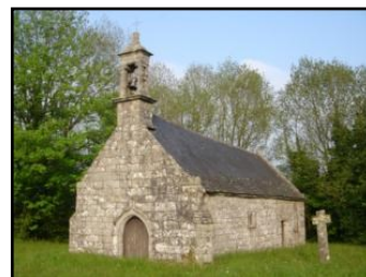
La chapelle Saint Modez

En plus de l'accès aux monuments de la ville, les chapelles Saint Trémeur et Saint Modez seront exceptionnellement ouvertes de 15h à 18h30 avec commentaires à disposition.