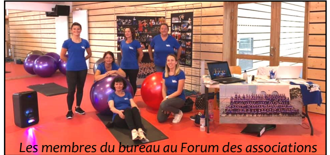
Les membres du bureau au Forum des associations

L'assemblée générale est fixée au 7 Octobre à 20h à la salle des Associations à Porz Ar Gozh Ker.