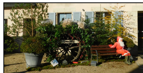
photo aux côtés du Père-Noël. Merci aux agents qui, chaque année, mettent à profit leur imagination et leur créativité pour nous offrir un peu de féerie à l'approche des fêtes de fin d'année. Nous rappelons qu'en raison des économies d'énergie, seuls l'église et le décor de la Mairie seront illuminés, jusqu'à 19h30 en semaine et le dimanche soir et 21h30 les vendredis et samedis soirs. Un système d'éclairage par LED, facteur d'économies a été choisi.

Les employés communaux ont installé un nouveau décor devant la Mairie, réalisé à partir de matériaux et d'objets de récupération. Cette scène de Noël qui mêle personnages et animaux en bois et Père-Noël, accompagnés d'une calèche, le tout dans un sous-bois créé de toutes pièces, est joliment mise en lumière. Les agents ont cette année accentué leurs efforts sur la décoration de la Mairie et travaillé sur une thématique de couleurs « bleu-blanc-rouge ». Cette mise en scène attirera comme toujours de nombreux curieux et les enfants pourront se faire prendre en