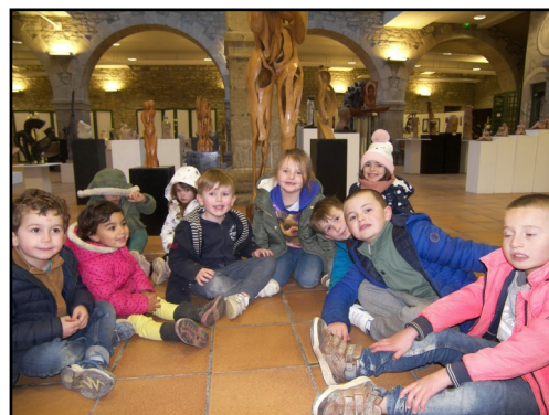
Photo : la classe de maternelle et CP devant les œuvres.

Les élèves étaient ravis de leur visite.