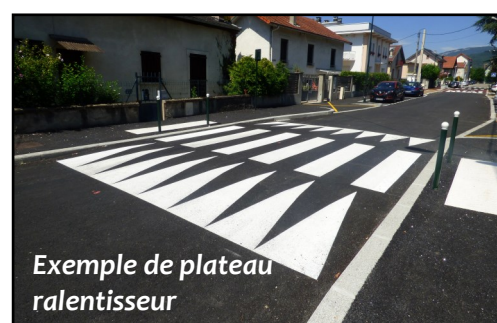
Exemple de plateau ralentisseur

chargée des travaux. Les aménagements de sécurité (c'est-à-dire les plateaux ralentisseurs) seront réalisés en même temps que la réfection de la voirie.